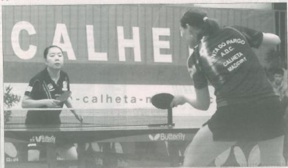
● A equipa feminina da ADC Ponta do Pargo teve na época passada um excelente desempenho, ao chegar ao melhor final da Taça ETTU.

Relembra-se que a exemplo de anos anteriores, estas fases da prova disputam-se em grupos, em sistema de poule a uma volta em casa de um dos clubes do grupo. Nesta 1.ª fase, tanto no sector masculino como no feminino, os dois primeiros classificados qualificam-se para a 2.ª fase da competição. ■