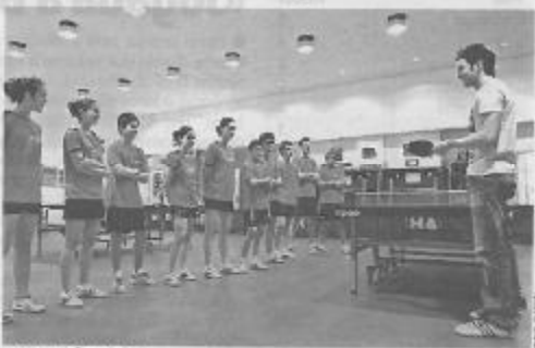
EXPERIÊNCIA. Jovens escutam lição do olímpico português