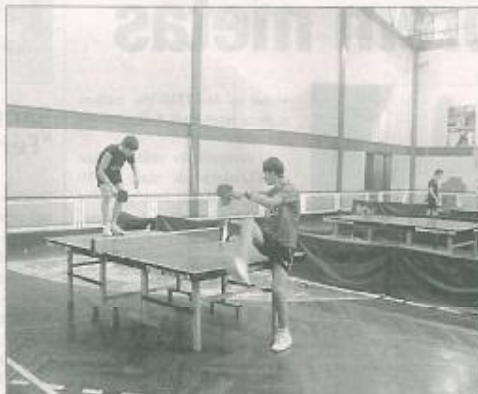
● Todos os escalões estiveram envolvidos e realizaram-se mais de 150 jogos.

Cruz, com os presentes delicados a aplaudirem, vaidosamente, os seus companheiros. Reinou muita alegria na excelente convivência de encerramento da época 2009/2010 da secção de Ténis-de-Mesa do Grupo Desportivo do Estreito.