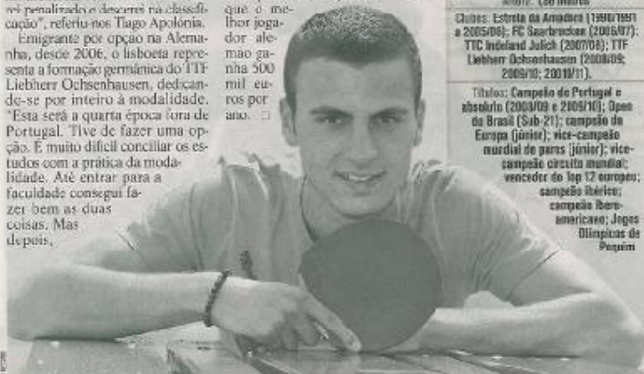
EMIGRANTE. Campeão português brilha no campeonato alemão e sobe no ranking mundial

Emigrante por opção na Alemanha, desde 2006, o lisboeta representa a formação germânica do TTF Liebherr Ochsenhausen, dedicando-se por inteiro à modalidade. «Esta será a quarta época fora de Portugal. Tive de fazer uma opção. É muito difícil conciliar os estudos com a prática da modalidade. Até entrar para a faculdade consegui fazer bem as duas coisas. Mas depois,