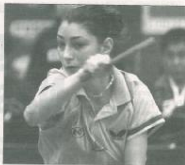
● A jogadora romena actua em Espanha.