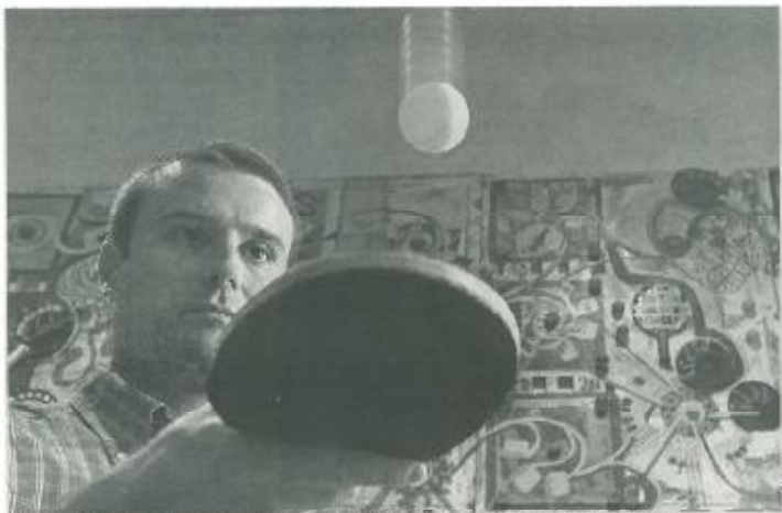
CRESCER. Líder federativo quer manter os atuais bons resultados e ver mais atletas a surgir

TÊNIS DE MESA ))) NOVO PRESIDENTE DA FEDERAÇÃO APONTA RUMO