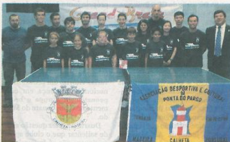
Equipas seniores e de formação já trabalham na Ponta do Pargo.