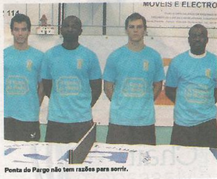
Ponta do Pargo não tem razões para sorrir.

No próximo sábado, em Lisboa, o Ponta do Pargo vai tentar inverter a lógica, no intuito de levar a meia-final a um terceiro jogo que se disputará domingo. F.S.