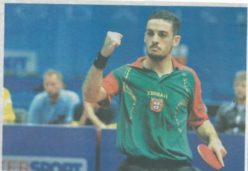
Madeirense actuou-se da melhor forma na prova que poderá ditar o seu segundo passaporte para os J. Olímpicos.

vinete anos, pois permitiu que estes agentes desportivos alcançassem tão elevado nível desportivo. Assim, para aqueles que continuam a apregoar que a política desportiva regional da RAM apenas provocou desgraças, fica aqui mais um registo que a mesma disponibilizou meios financeiros, instalações desportivas e recursos humanos especializados, que foram rentabilizados e potenciados pelas instituições e agentes desportivos do Ténis de Mesa e não só. Portanto, só podemos afirmar: valeu a pena todo o investimento que se fez nesta modalidade, em particular, já que os resultados assim o demonstram, quer a nível regional, nacional e internacional, assim como no desporto em geral. Contudo, temos conhecimento que nem tudo foi exemplar, algumas coisas podiam ter sido, eventualmente, evitadas. Todavia, não podemos nem devemos aceitar que cataloguem os agentes desportivos como esbanjadores de dinheiros públicos, pois a maioria das pessoas desconhece a realidade desportiva e do muito trabalho "invisível" que é necessário fazer para que as várias iniciativas tenham continuidade e visibilidade. Enfim, não basta ler as notícias para depois opinar. É preciso algo mais!