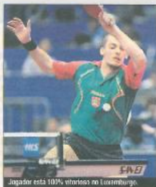
Jogador está 100% vitorioso no Luxemburgo.

O jogador madeirense venceu o seu grupo e luta por uma das 11 vagas disponíveis para os Jogos Olímpicos do próximo Verão. A 2.ª fase, a eliminar, começa hoje e será decisiva para chegar às olimpíadas.