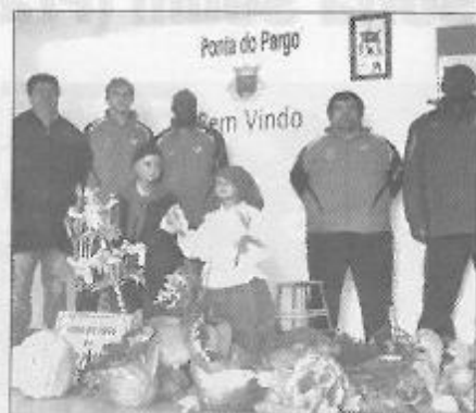
Calhetenses perderam (1-4) com o Sporting CP