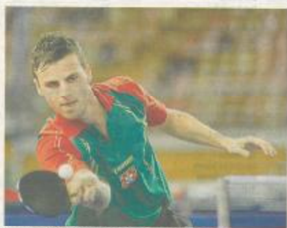
Quase > Apolónia perdeu uma final, mas está em prova