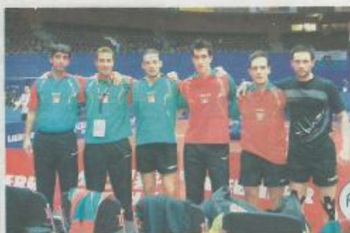
Seleção masculina ficou no 11.º lugar, o melhor registo de sempre.

A semana encerrou com os "Jogos Tradicionais", da responsabilidade dos alunos do 10.º o.